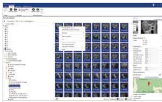
Selezionare le immagini per la modifica in gruppo

Le specifiche sono soggette a modifiche senza preavviso. Per le specifiche più aggiornate, visitate www.flir.com